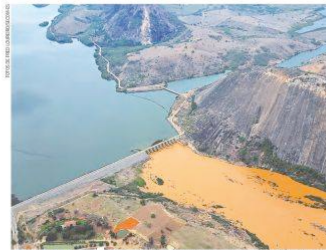
SEGUNDA-FEIRA. A água do Rio Doce, misturada com a lama, chega à Usina de Amonis, na divisa com ES