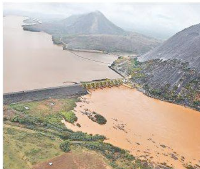
TERÇA-FEIRA. A lama invade a represa, que vira enorme lamaçal, numa tragédia sem precedentes