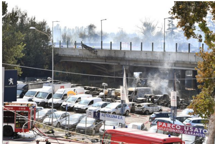
Tra le macerie, il giorno dopo l'incidente autostradale a Bologna